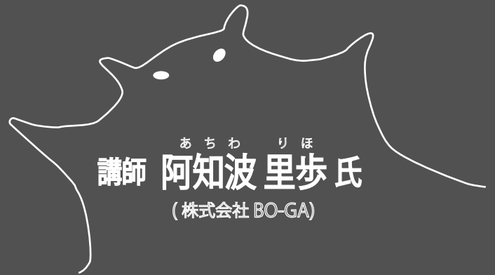
あちわりほ 講師 阿知波里歩氏 (株式会社 BO-GA)

日時 令和4年10月15日(土) 13:30～16:00 (受付 13:00～)